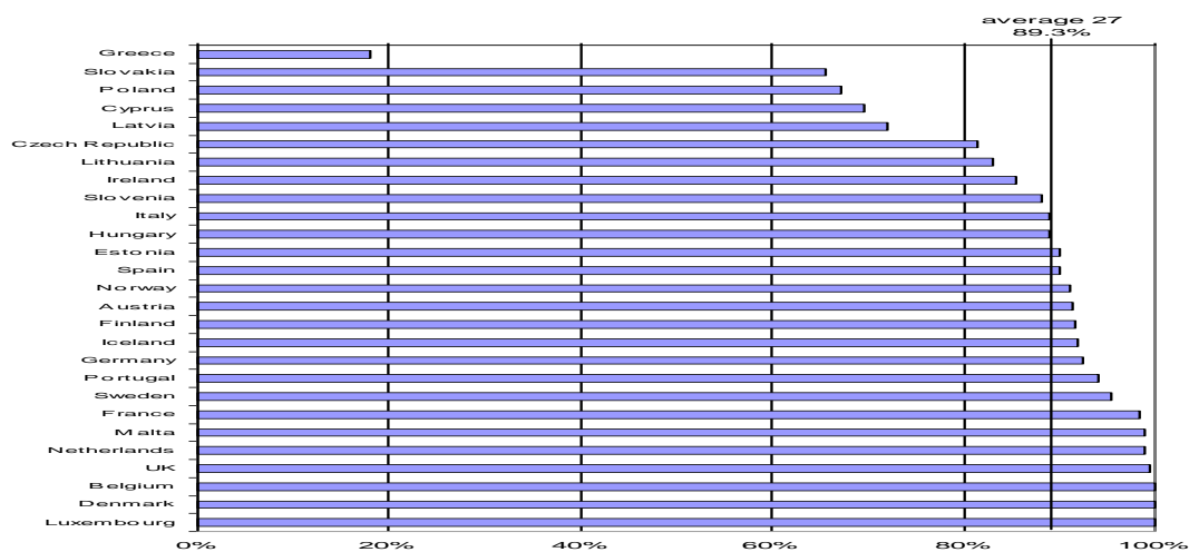
Gráfico 1: Cobertura, em termos percentuais, com banda larga na EU-27

Como se pode observar pelo Gráfico 1, a União Europeia dos 27 países apresenta uma taxa média de cobertura de banda larga que se situa em 89,3% do total da sua população. Quando se faz uma observação mais particularizada pode-se afirmar que a grande maioria destes países já ultrapassou o valor de 80%. Quatro países já possuem 100% de cobertura: Reino Unido, Bélgica, Dinamarca e Luxemburgo. Neste conjunto de países a Grécia é o país que apresenta a pior performance com um valor que tende a aproximar-se dos 20% de cobertura nacional. Neste particular, Portugal pode regozijar-se porque apresenta um valor acima da média da EU-27 cifrando-se acima dos 90%.